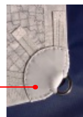
zewnętrzne pierścienie rogów zabezpieczone skórą