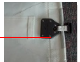
wysokowytrzymałe zakończenie listew