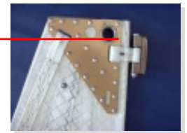
wysokowytrzymała aluminiowa głowica

podwójny lub potrójny trzystopniowy ścięg z wewnętrzną trymlinką liku