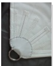
obszycie zewnętrznych pierścieni