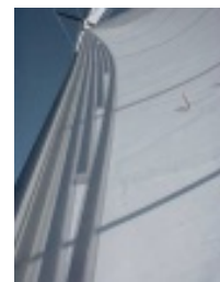
wielościeżkowy system refowania żagla